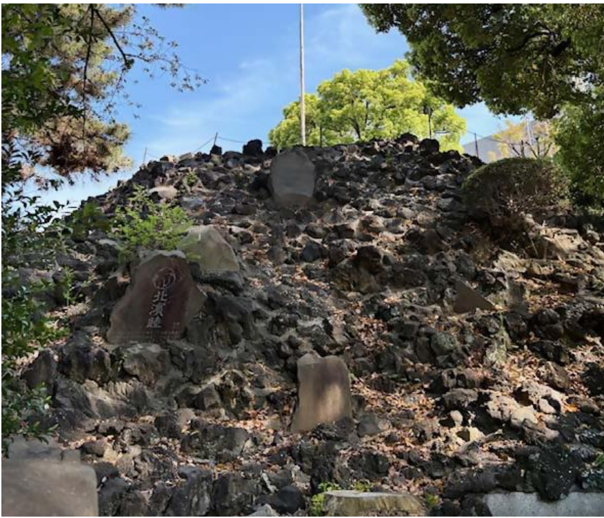
【図5】「品川区指定有形民俗文化財 品川神社富士塚」品川神社

今回は、展示に関連して「富士塚」について紹介しました。富士塚は、江戸時代の庶民にとって身近な富士信仰の象徴であり、時代や社会の変化を受けながらも今日まで大切に守られてきました。本記事や開催中の展示を通して、形を変えながら現在も続く富士信仰の文化と富士塚に興味を持っていただければ幸いです。