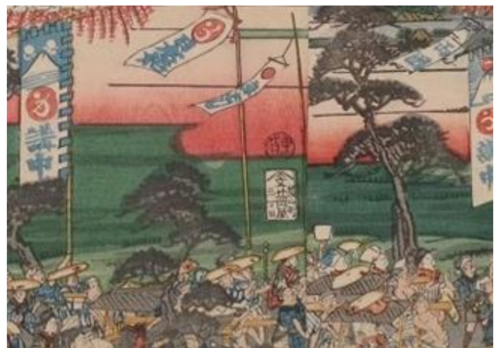
【図2】歌川芳藤「庚申年富士山参詣群集之図」(抜粋)

この浮世絵が描かれた万延元年（一八六〇）の年は暦で庚申の年にあたります。富士山が庚申の年に出現したという伝説から、この年に富士山を拝むと33回登ったのと同じご利益が得られるほか、普段富士山への登拝が許されていない女性たちも五合目まで登ることができたため、【図2】のように多くの人が富士