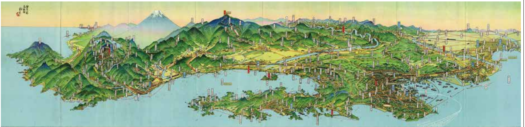
よしだ はつさぶろう かながわけんかんこうずえ 吉田 初三郎 「神奈川県観光図絵」

文字で場所の名前が書かれていたりします。それぞれの場所にどんなものがあるのか、どのようなどころかわかるようになっていきますね。