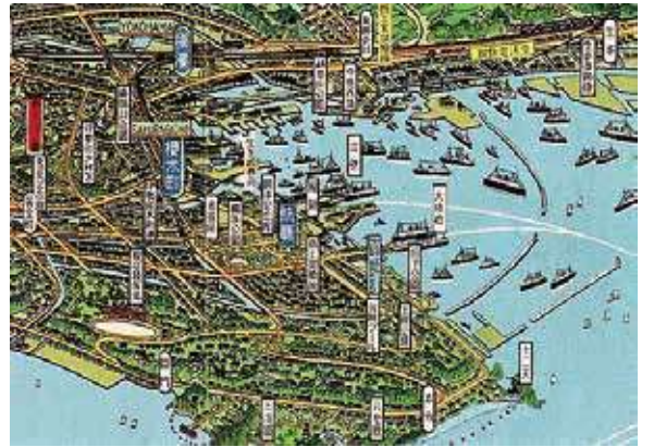
船がたくさんとまっているね