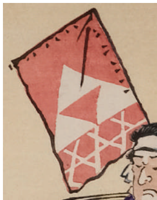
さくしゃふししょう 作者不詳 「歌留多あわせ かまくらおしやろっかせん 鎌蔵武勇六家仙」(部分)