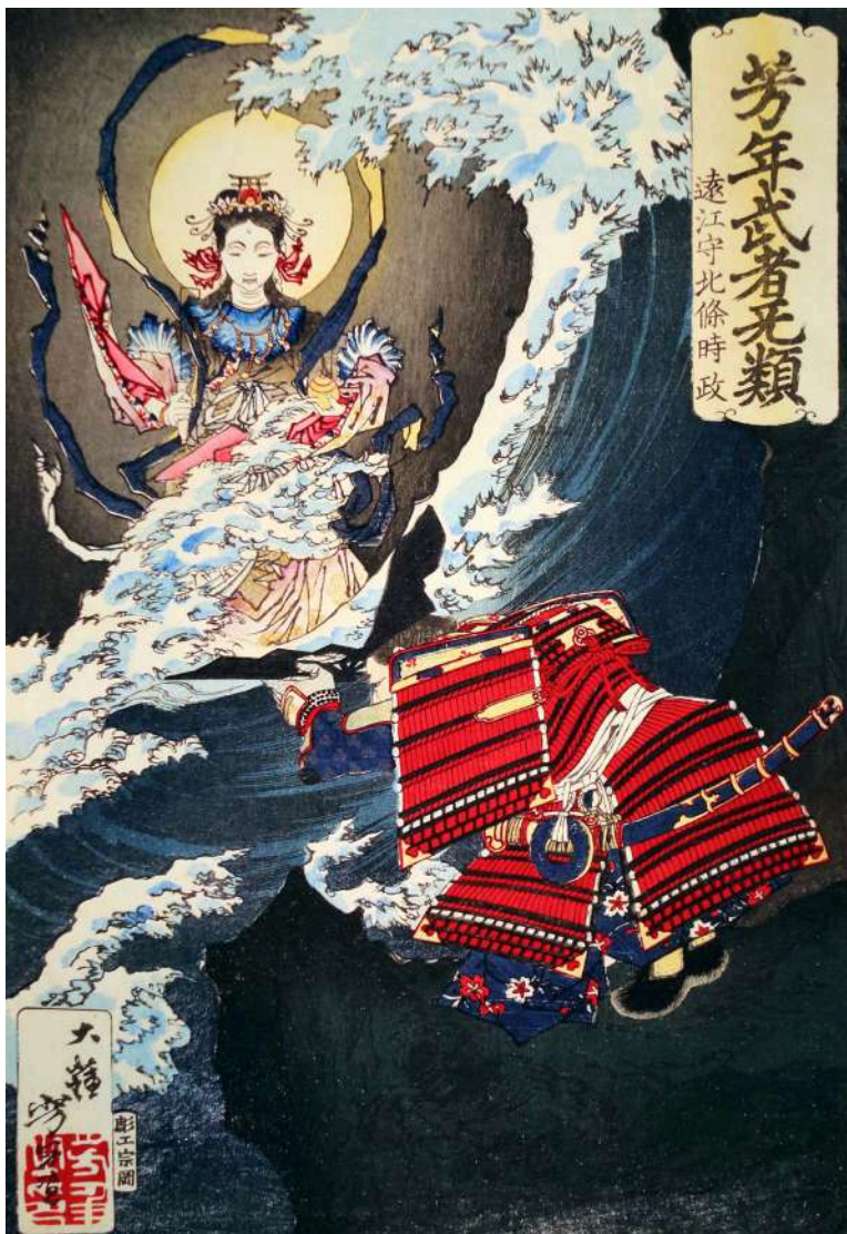
つきおかよしとし よしとし むしゃ ぶるい とおとうみのかみほうじょうときまさ 月岡芳年「芳年武者无類 遠江守北條時政」

この絵にはひざをついたお侍さんと嵐みたい 高い波の間に浮かぶ不思議な女性が描か ね。じつはお侍さんは北条時政っていう人で、女 性は江島神社にまつられている女神の弁財天なん だ！ この絵は北条時政が江の島の岩屋に「一族が将 来もずっと続きますように」ってお参りしたら、